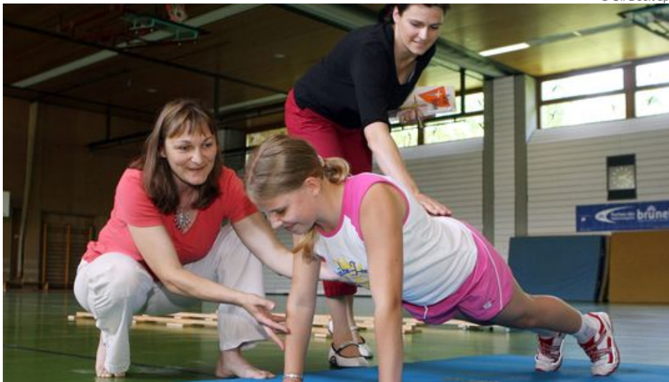
Motologen bei der Arbeit mit einem zehnjährigen Mädchen

Es ist laut in der Sporthalle. Einige Kinder liegen auf Rollbrettern und werden von Erwachsenen durch die Halle gezogen. Die Kinder johlen, haben Spaß. Was aussieht wie ein Spiel, soll die motorischen Fähigkeiten der Kinder fördern. Entwickelt werden Übungen wie diese von Motologen.